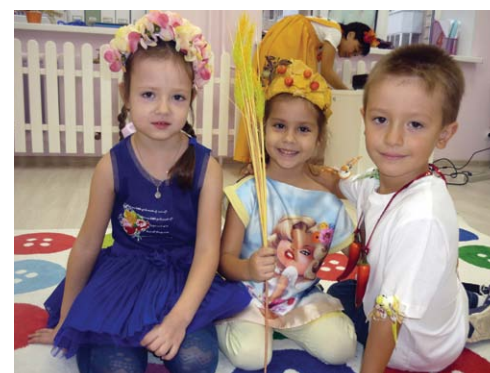
Магнитогорск, на Тевосяна