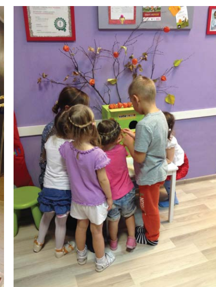
Москва, в Жулебино