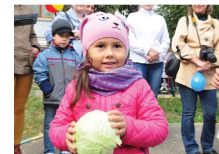
Казань, на Вахитова