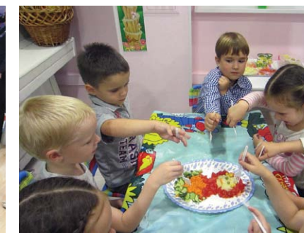
Самара, на Управе