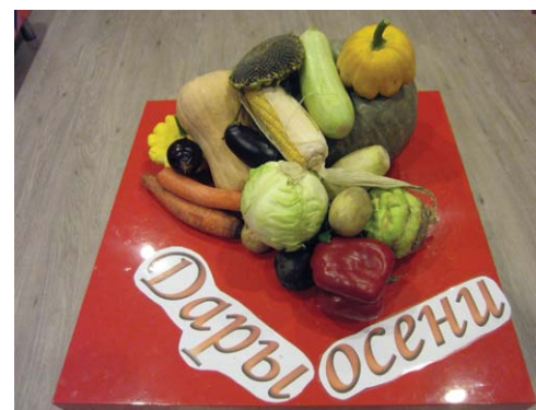
Ленинградская обл., во Всеволожске