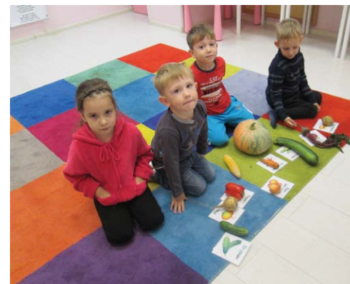
Казань, на Вишневого