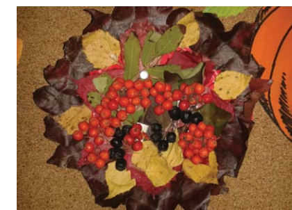
Химки, на Калинина