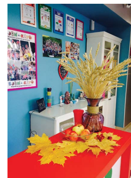
Магнитогорск, на Ломоносова