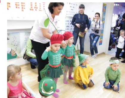
Тольятти, на Мира