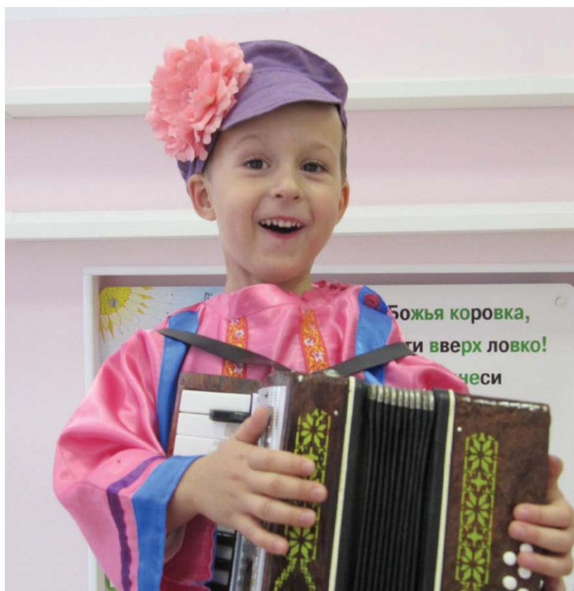
Челябинск, на Тополиной Аллее

А теперь приглашаем вас в галерею осенних Бэби-клубов.