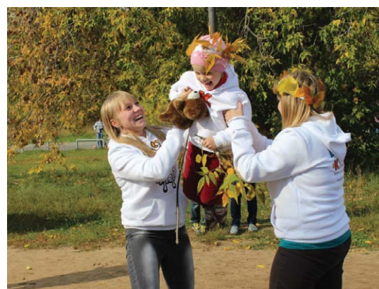
Москва, в Строгино