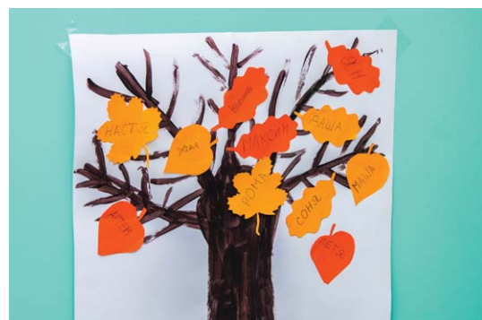
Москва, в Северном Тушино