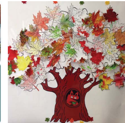
Московская область, в Щелково