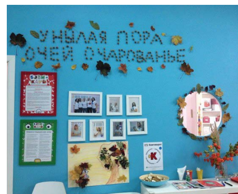
Москва, в Перово